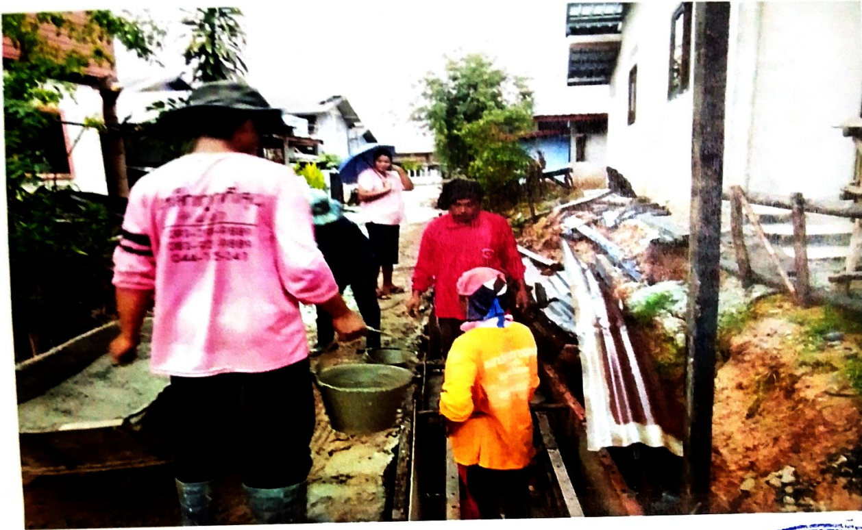
(สภาพทั่วไป)