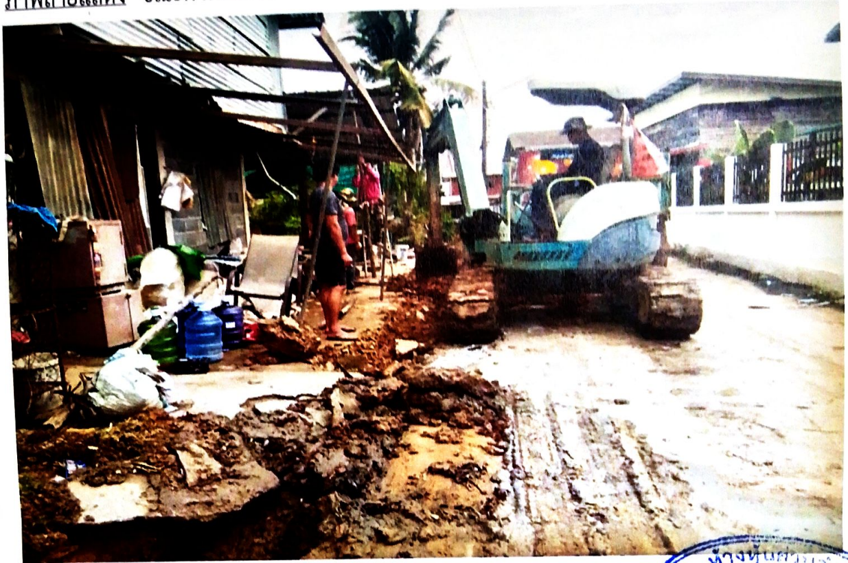
(สภาพทั่วไป)